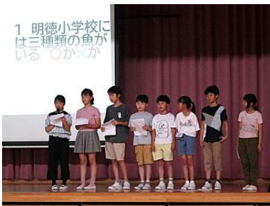
環境飼育「明德小生き物クイズ」

本校では、キャッチフレーズである「心はずむ、楽しい学校」づくりにつながるように、「毎日がハッピーデー」と銘打って活動しています。その柱と「特別なハッピーデー」も企画してきました。これまで、①入学式②1年生を迎える会③明德運動会④6年修学旅行⑤5年まんたらめ宿泊研修⑥明德マラソン⑦明德発表会について子どもたちのハッピーな様子を学校報を通じて伝えてきました。さらに、5・6年生の委員会の子どもたちが自主的に企画・主催した「ハッピーデー・スペシャル企画」もありましたので紹介します。運営委員会は下記の他、HPの「ハッピーデー」でも紹介しましたが、「健康ウィーク（縄跳びサバイバル、リズムゲーム、玉入れ等）」「ドッジビー大会」を企画しました。