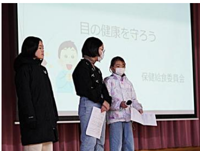
保健給食「目の健康を守ろうクイズ」

読書や活字への興味を広げてもらおうと本探しスタンプラリーや辞書早引き大会等が企画され、図書室は大賑わいでした。景品のしおりやポストカードをもらい大喜びでした。