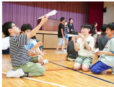
運営「紙飛行機大会」

学校の玄関内に暮らすメダカやカメは子どもたちの大好きな仲間です。その仲間に関する問題が出されました。正解するたびに歓声を上げる子どもたちでした。