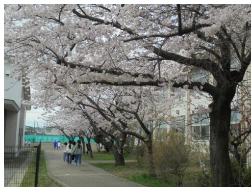
<グラウンドへとつながる道 今年も桜がきれいに咲きました>

今年で創立53年目となる八橋小学校。今までの歩みを大切に、職員一同、精一杯指導・支援して参ります。今年度も、本校教育へのご理解とご協力をどうぞよろしくお願いいたします。