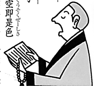
〔図解 般若心経入門〕 ナツメ社、2012年、p.15

仏説摩訶般若波羅蜜多心経 親自在菩薩 行深般若波羅蜜多時 照見五蘊皆空 度一切苦厄 舍利子 色不異空 空不異色 色即是空 空即是色 受想行識 亦復如是 舍利子 是諸法空相 不生不滅 不垢不淨 不增不減 是故空中無色 無受想行識 無眼耳鼻舌身意 無色声香味触法 無眼界 乃至無意識界 無無明 亦無無明尽 乃至無老死 亦無老死尽 無苦集滅道 無智亦無得 以無所得故 菩提薩埵 依般若波羅蜜多故 心無罣礙 無罣礙故 無有恐怖 遠離一切顛倒夢想 究竟涅槃 三世諸仏 依般若波羅蜜多故 得阿耨多羅三藐三菩提 故知般若波羅蜜多 是大神咒 是大明咒 是無上咒 是無等等咒 能除一切苦 真實不虛 故説般若波羅蜜多咒 即説咒曰 羯諦羯諦 波羅羯諦 波羅僧羯諦 菩提薩埵訶 般若心経