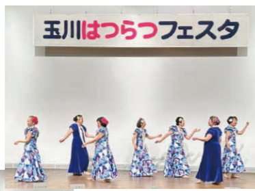
息の合ったステップ