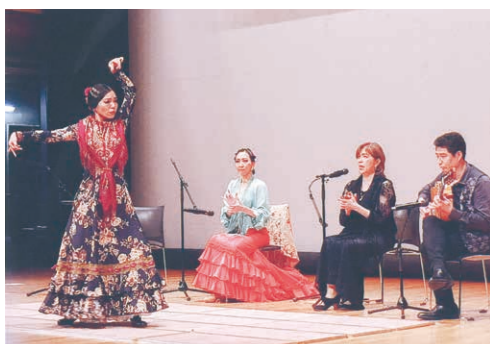
踊り・歌・ギター「フラメンコ」

演芸はコーラスをはじめとする多岐に渡る分野の発表で、踊りあり、カラオケあり、手話ダンス、