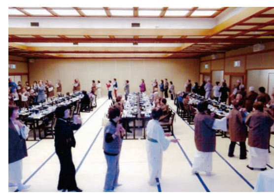
会の締め炭坑節踊り

令和7年度研修旅行は11月25日、26日。笠間稲荷神社参拝。いわき市石炭化石館見学。いわき震災伝承みらい館見学と語り部講話にバス2台(83名)で参加しました。 ①雨が降る中、笠間稲荷神社へ。前日までの菊まつりの花が迎えてくれてホッとしました。 ②いわき市石炭化石館見学では、化石展示(いろいろな国の恐竜)と模擬坑道(機械のない手作業、先人たちの知恵のすごさを感じた) 宴会は大広間でカラオケに。最後は全員で炭坑節を踊り、いつもながら皆さんのご協力で楽しく幕を閉じることができました。