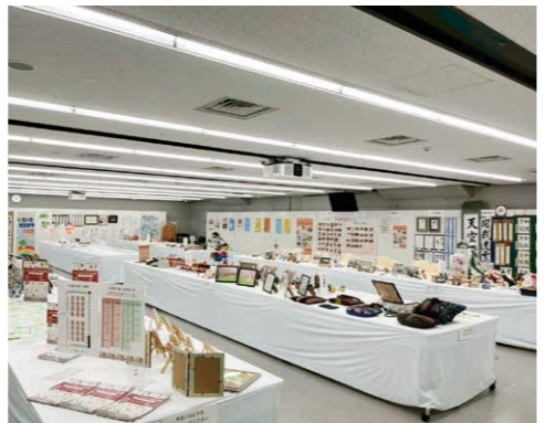
華やかな作品展示

埋めつくしました。どの作品も力作揃いで華やかな展示となりました。たくさんの方にご参加、ご来場いただき賑やかで楽しい文化祭となりました。