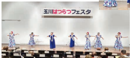
表情豊かにダンス

上野毛若葉会フラは毎月第2・第4火曜の13時～14時半、上野毛地区会館2階和室にて開催中。あ、瘦せたかどうかは、ぜひ見に来てご判断を！