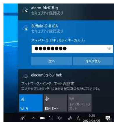
【パスワード入力画面】

※ ルーター (電波を出す機械) の底面などに、 Wi-Fi名 (SSID) と一緒にパスワードが 記載されています。 「PassWord」、「Pass」、「Key」、 など機種によって表示が異なりますが、主にアル ファベットと数字の組合せになっています。