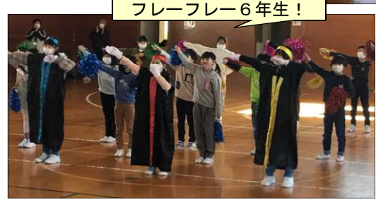
フレイフレー6年生!