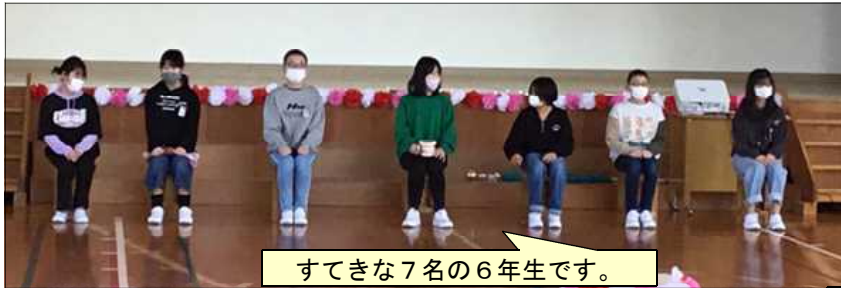
すてきな7名の6年生です。