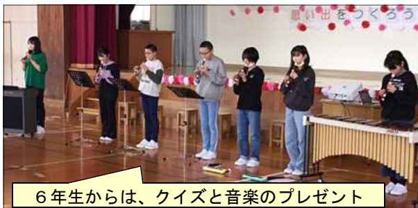
6年生からは、クイズと音楽のプレゼント