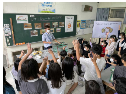
みんなで実験結果を予想しました