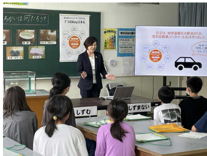
イノベーターについての説明

9月28日(木)総合的な学習の時間に5年生が日立財団の〇〇さんをお招きし、イノベータープログラムに取り組みました。新しい考え方で大きな変革を生み出すイノベーション、それを実行するイノベーターについて学びました。