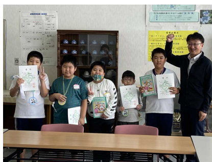
みんなで喜びました

9月29日(金)CNAアリーナで第54回秋田市なかよし運動会が開催されました。多くの観客に見守られる中、本校児童は徒競走、趣向走、ダンスの三部門で練習の成果を発揮することができました。たくさんの賞状をいただき、校長室で表彰されました。