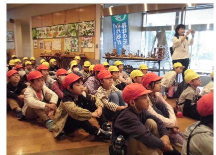
真剣に話を聞く2年生