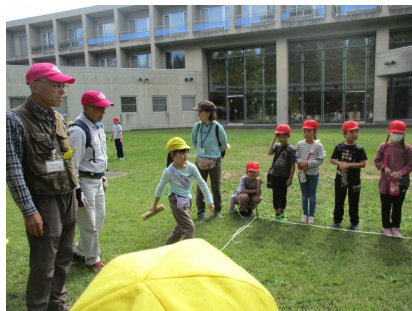
楽しかったモルック体験

9月29日(金)2年生が校外学習で森林学習交流館プラザクリプトンを訪れました。森の中を散策したり、展示室でクイズに取り組んだり生活科の学びを深めることができました。モルック体験もしてみんなで大いに盛り上がりました。