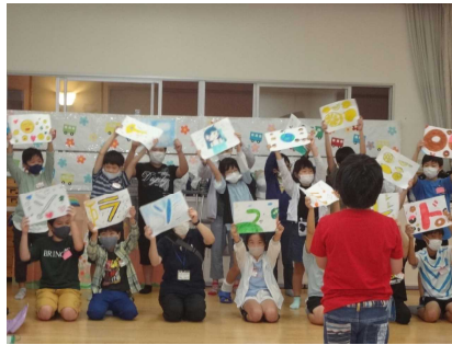
ウェルビューいずみこども園

9月25日(月)4年生がひかり幼稚園とウェルビューいずみこども園を訪問し交流会を行いました。