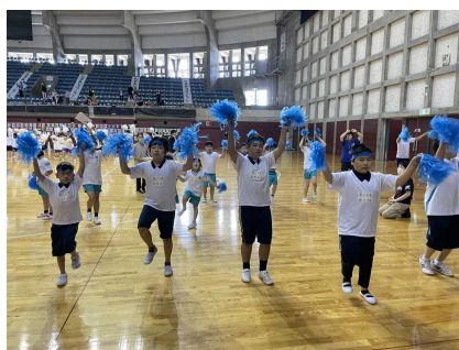
練習の成果ができました