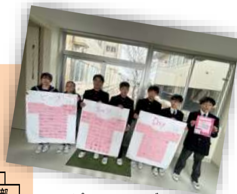
ピンクシャツデー