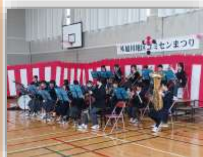
外旭川地区コミセンまつりでの演奏