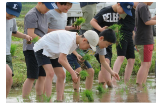
四ツ小屋名物 田植え体験