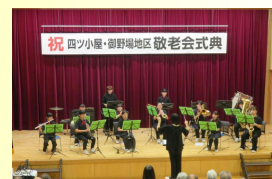
地域の敬老会への参加

安全パトロール隊及びふるさと先生との対面式、吹奏楽部の演奏会等の機会を通し、子どもたちの様子を共有しよりよい学校運営を目指します。