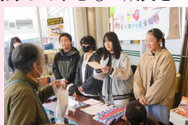
ハピ-ライブ♪DJE外 四ツ小屋幸福朗販売

各種通信、メール、HP等で情報を発信します。校報を地域配付し学校の取組を共有します。