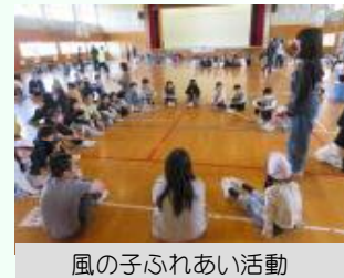
風の子ふれあい活動

・「こんな学校にしたい」という子どもたちの思いを、計画委員がテーマにしました。実現を目指し、明るく元気な学校をつくります。