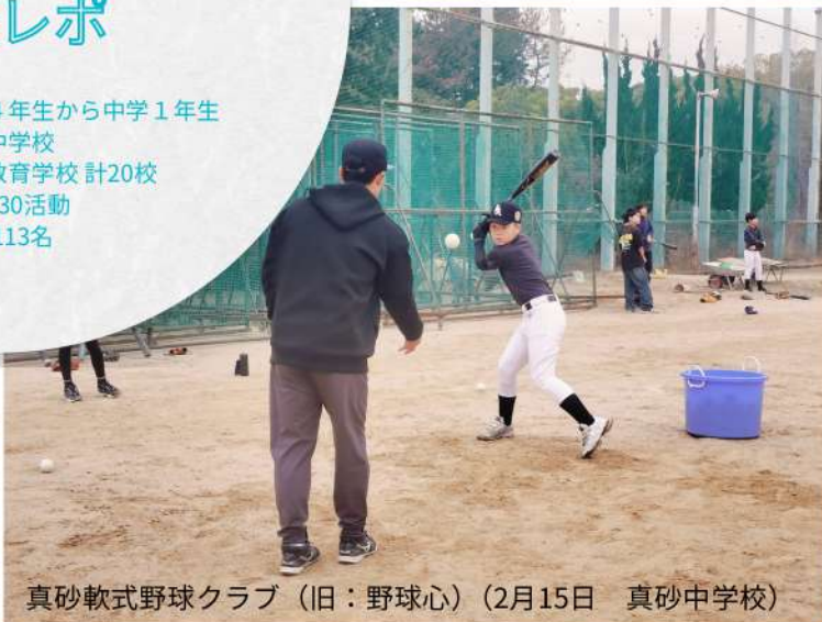
真砂軟式野球クラブ (旧：野球心) (2月15日 真砂中学校)

先月行ったオープン・プレミヤでは、各中学校で実際に活動を始めるプレミヤクラブを中心にたくさんの子供たちに活動の体験をしてもらいました。