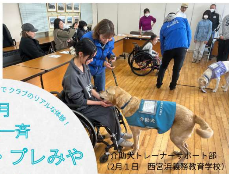
介助犬トレーナーサポート部 (2月1日 西宮浜義務教育学校)