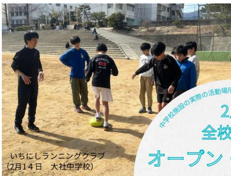
いちにしランニングクラブ (2月14日 大社中学校)

中学校の部活動にかわる西宮の新しい活動「プレミヤ」 令和8年9月本格実施に向けて市内の各地域や学校など各方面で様々な準備や整備が着々と進められており、すでに「プレミヤ」は動きはじめています。 プレミヤTIMES（タイムズ）では、地域や学校の声から、プレミヤの展望や子供たちのこれからがどのように変わっていくのかなど、随時「プレミヤ」について情報を発信していきます。