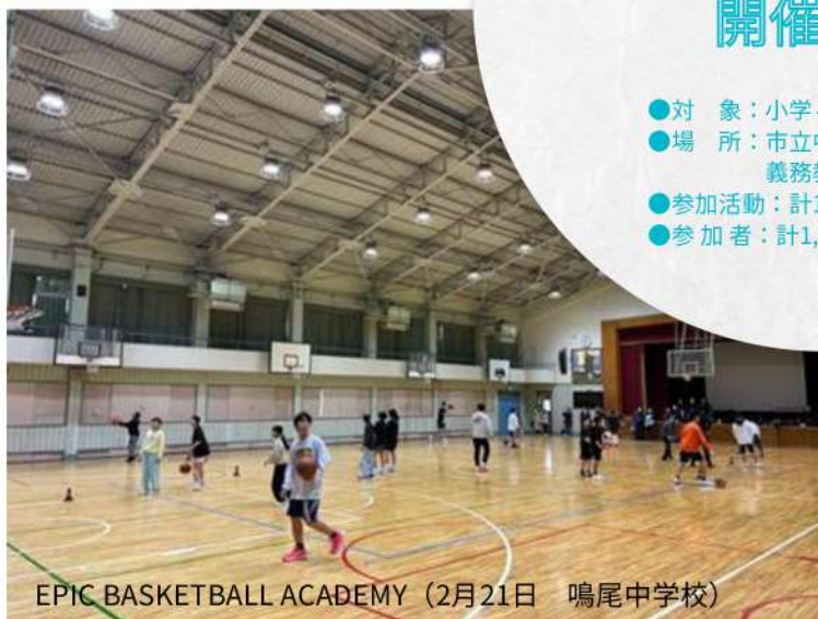
EPIC BASKETBALL ACADEMY (2月21日 鳴尾中学校)