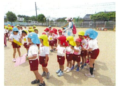
【なかよし(異年齢)活動】