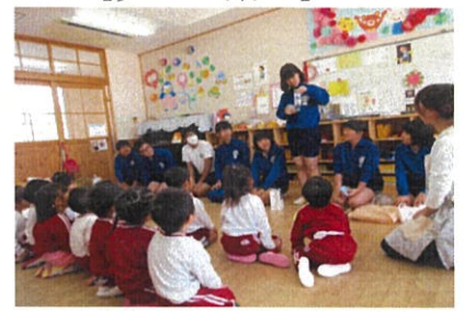
【末武中学生との交流】