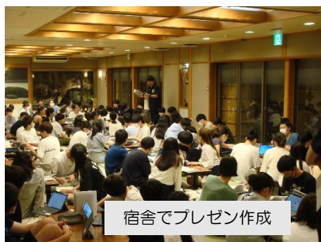
宿舎でプレゼン作成