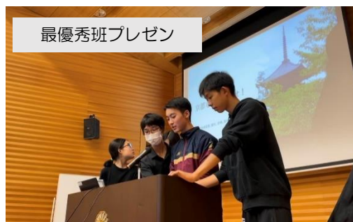
最優秀班プレゼン