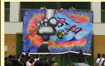
美術部作品ビッグアート