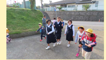
さわやかマナーアップ運動