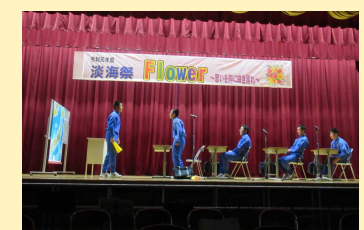
淡海祭ステージ発表