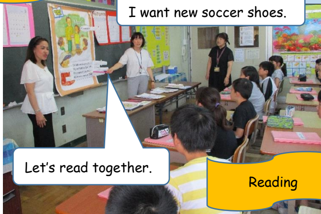
Let's read together.