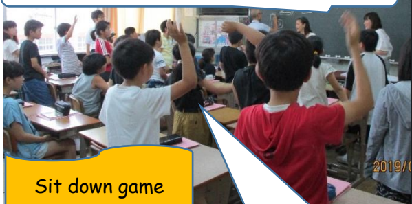
Sit down game