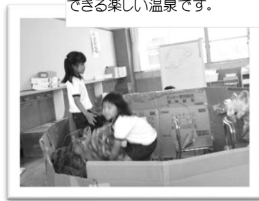
ゆり組の温泉。トンネルをくぐって出入りできる楽しい温泉です。