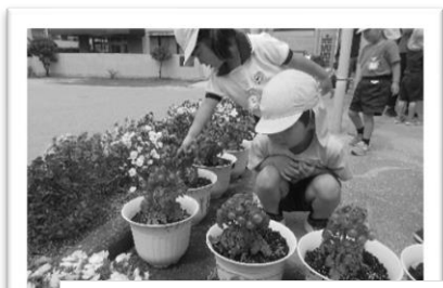
ミニトマト収穫。どのタイミングで収穫するかを考えるようになりました。

今月はプールや、七夕、夏祭りなど、夏を楽しむ保育が予定されています。大人も子供も体調に気を配り、元気に過ごせるといいですね。