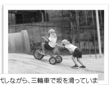
交代しながら、三輪車で坂を滑っています。スピードを調整できるように互いを気遣っています。