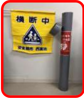
この筒の中に↑旗が入って

各家庭にお渡しできる少し小さい横断旗もあります。希望される方は学校までご連絡ください。