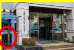
入口左側の駐輪場の青い 柱横に取り付け