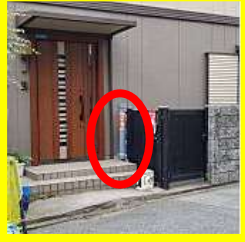
玄関脇の黒い柵に取り付け

★旗設置場所:カワセ様宅 天理教前、イトマン南側、ユニ ーブル西宮前、学研教室前分