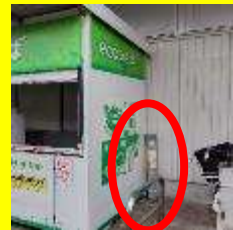
リサイクルボックスの右側