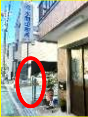
東側のフェンスに取り付け

★旗設置場所:カワセ様宅 天理教前、イトマン南側、ユニ ーブル西宮前、学研教室前分